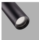
Difusor Ø45 / Diffuser Ø45 Difusor Ø55 / Diffuser Ø55