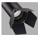
Aletas Ø45 / Flippers Ø45 Aletas Ø55 / Flippers Ø55