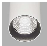
Aro negro Ø45 / Black ring Ø45 Aro negro Ø55 / Black ring Ø55

(Combinables entre ellos / Combined with each other)