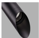
Visera Ø45 / Visor Ø45 Visera Ø55 / Visor Ø55