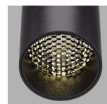
Panel de abeja Ø45 / Honeycomb Ø45 Panel de abeja Ø55 / Honeycomb Ø55