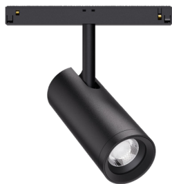
12W / 16W